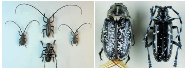
Links: männliche Käfer der drei in Deutschland und Österreich vorkommenden Monochamus -Arten mit ALB (unten Mitte); Rechts: Walker und ALB (rechts).

Eine Verwechslung der erwachsenen Käfer mit heimischen Insekten ist auf Grund ihrer Färbung kaum möglich. Am ähnlichsten sind die Monochamus -Arten M. galloprovincialis , M. sutor und M. sutor , deren Wirtsbäume jedoch Nadelgehölze sind. Ein selten vorkommender, großer schwarzer Käfer mit weißen Zeichnungen auf den Flügeldecken ist der Walker ( Polyphyllo fullo ), der zu den Blatthornkäfern gehört und auf Grund seiner Körperform eher einem Maikäfer ähnelt.